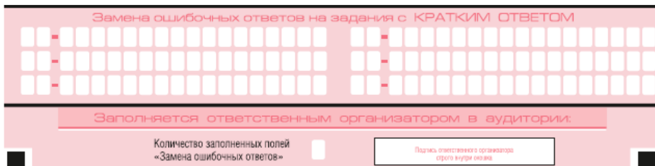
Рис. 9. Область замены ошибочных ответов на задания с кратким ответом

Запрещается записывать ответ в виде математического выражения или формулы. В ответе не указываются названия единиц измерения (градусы, проценты, метры, тонны и т.д.) – так как они не будут учитываться при оценивании. Недопустимы заголовки или комментарии к ответу.